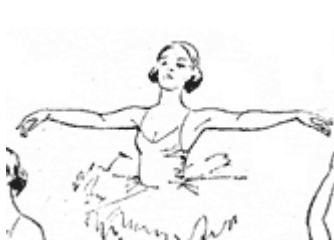
1 позиция ног

Подготовительное положение рук, 1 позиция, 2 позиция, 3 позиция